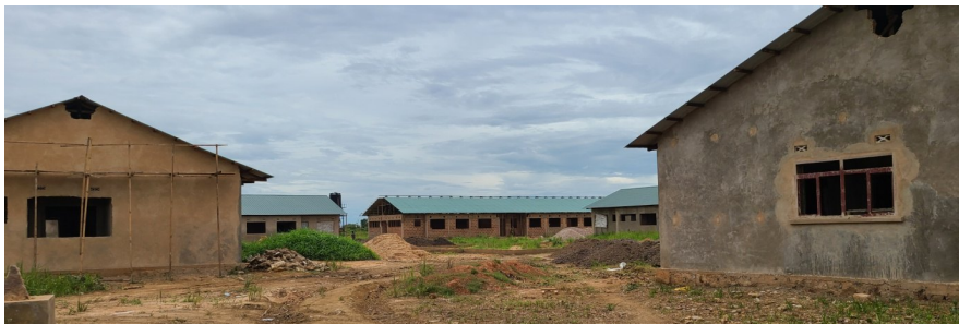
Figure 1: Entrée des