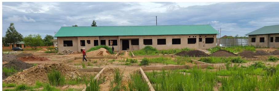
Figure 14: Bâtiment